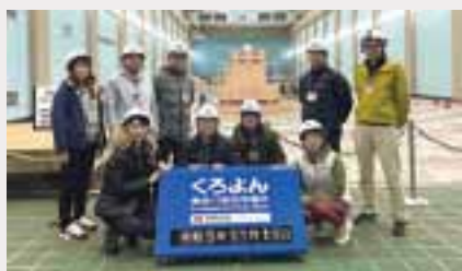
黒部川第四発電所にて