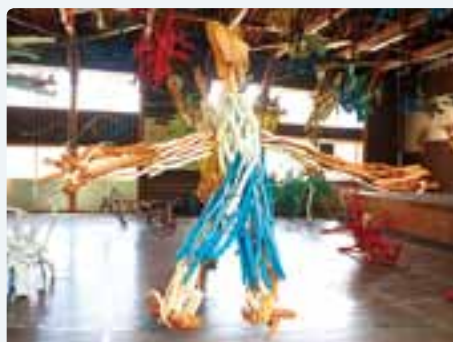
絵本と木の実の美術館 独創的なオブジェが今にも動き出しそうです。