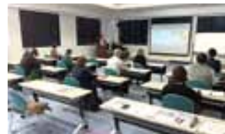
実施したセミナーの様子

新型コロナウイルス感染症等の影響やデジタル化、インボイス制度導入、エネルギーその他の物価高騰等の対応といった事業環境変化による影響を受ける中小・小規模事業者からの経営相談や各種申請サポート対応等を行うため、インボイス制度やIT、デジタル化に向けたセミナー・個別相談会などを実施し、本年度の事業環境変化対応型支援事業は全て終了いたしました。