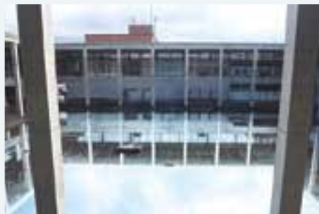
越後妻有里山現代美術館 MonET 水面に建物が反射し 幻想的な世界観が楽しめます。

当日は十日町市職員、十日町商工会議所事務局長に懇談会の時間を設けて頂き、2000年に開催された初回は約16万人の入込客数であったのが回数を重ねる毎に増え、2022年の第8回は57万人もの入込客数があったとの説明を頂きました。懇談会終了後は昼食会を開き懇親を深めました。