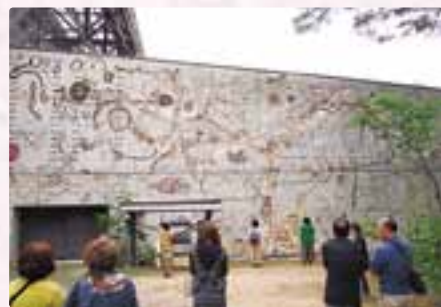
第1回 芸術祭ツアーの様子