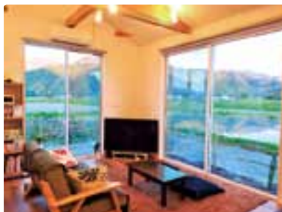
自然が広がるリビング