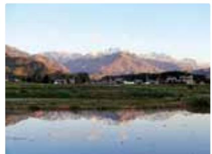
リビングから見た北アルプス