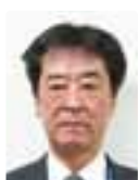
専務理事退任のご挨拶

商工会議所が目指す活力あふれる地域づくりのため、これまでに培った経験を活かし、関係する様々な団体、機関の皆様方のご支援、ご協力をいただきながら、微力とは存じますが、会頭、副会頭をサポートし、商工会議所スタッフ一丸となって様々な課題に積極的に取り組んでまいります。ご指導のほどをよろしくお願いたします。