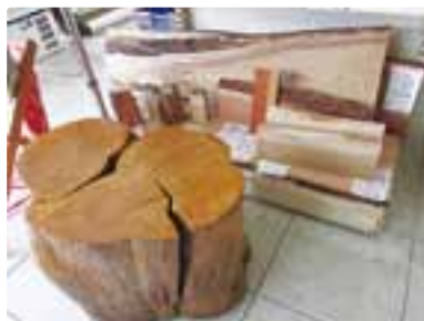
棚にも、カウンター用にも、用途は無限大!

林業は100年単位の森づくりと木材生産を構想する、世代を超えた仕事です。地域にとって望ましい森林と、活用しやすい木材の在り方を見極めることで、豊かな森林を再生し、生業としての林業、木材業を復興させることを目指しています。