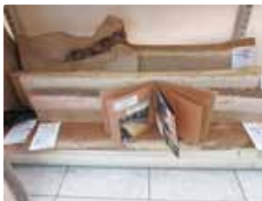
木崎湖畔 Yショップでニシデ木材を展示販売しております