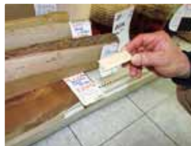
商品ラックの隙間に入れられるような細かい木も加工できます