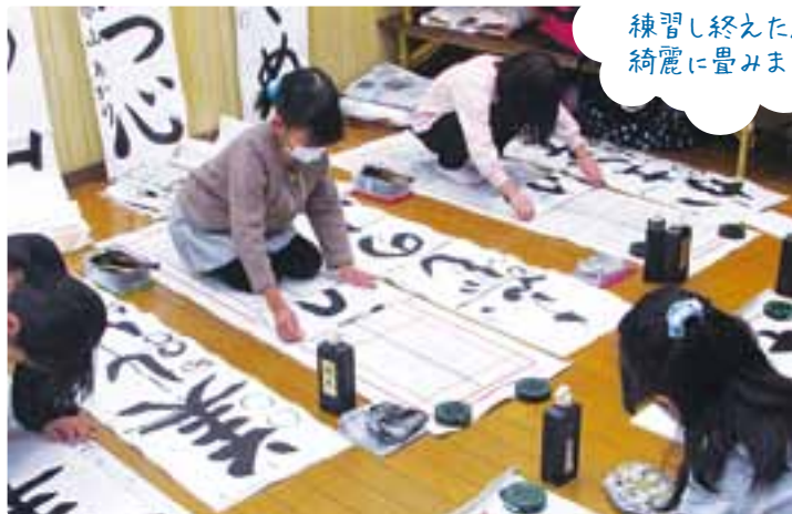
練習し終えた紙は 綺麗に畳みます