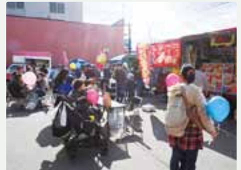
天気も良く、大勢の方で賑わいました♪

お客様からは「寒空の中、温かくて美味しいグルメと活気がある商店街を見て、心も体も温まった。」「回数を重ねてだんだんと知名度が上がってきた。これからも続けていってほしい。」とイベントに対して激励の言葉をいただきました。