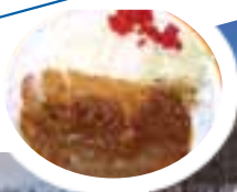
人気の カツカレー 1,200円(税込)