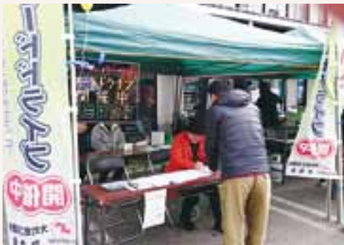
大勢の方々にご寄付を頂きました ありがとうございました!!

集まった食品は必要な方に有効に利用されるよう、11月18日に大町市社会福祉協議会にお届けいたしました。寄付をしていただいた皆様に感謝するとともに、今後も社会貢献に努めてまいりたいと思います。