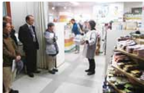
実際にまちゼミを行っている事業所よりお話を頂きました