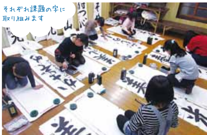
それぞれ課題の字に 取り組めます