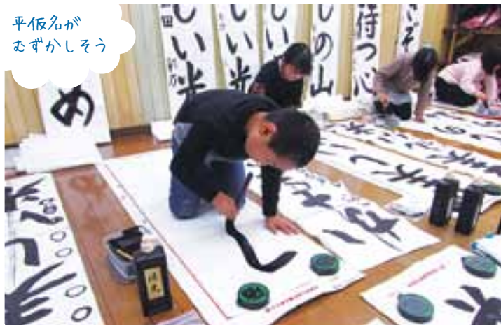
平仮名が おぼろしく