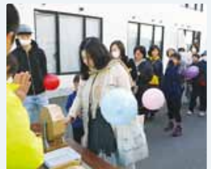
福引、みんな当たったかな?

また、大町市地域包括支援センターのご協力により「記憶地図作成プロジェクト」を実施しましたが、ご来場いただいた方は、展示した当時の中心市街地の面影を写すモノクロ写真や、沢山の古い写真のなかから大町の風景を探すクイズなどで盛り上がり、昔話に花が咲く光景も見受けられ、盛況のうちに幕を閉じました