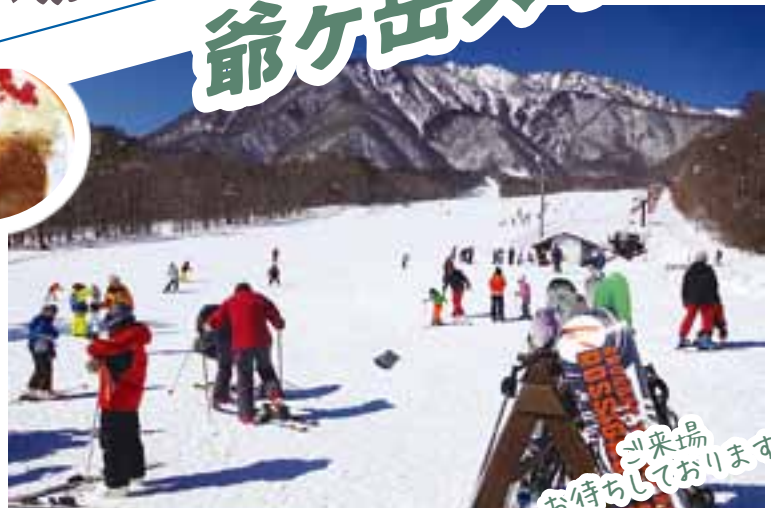
お帰りの準備 お待ちしております!!

ほぼ全てのグレンデが広くて見通しの良い中緩斜面という初心者でも安心・安全なスキー場だから、初めてのスキー・スノボにピッタリ！！しっかり練習したい人にもおすすめです。晴れた日には安曇野北部の景色を覗き見ることができ、爽快な滑走が可能です。各スキー、スノーボード教室も実施しています。