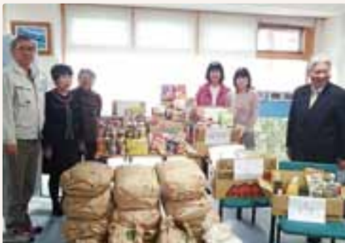
大町市社会福祉協議会を通して 寄付させて頂きました