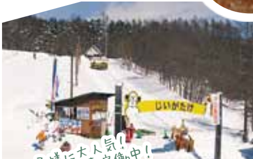
お子様に大人気！ トロイカも絶賛稼働中！