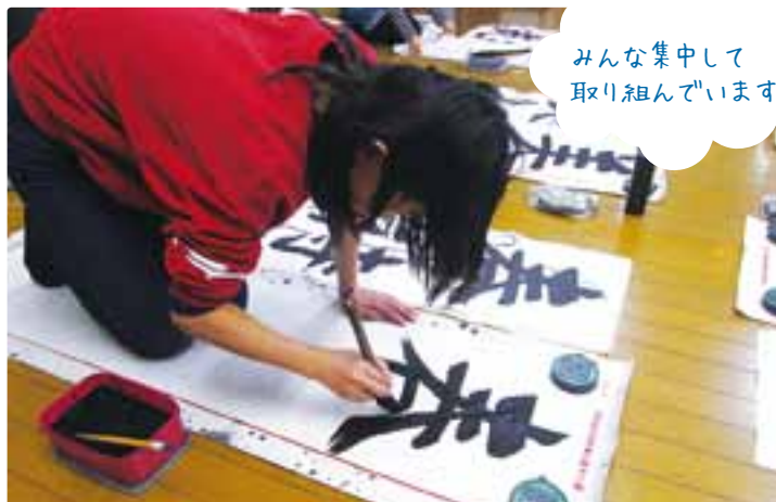
みんな集中して 取り組んでいます